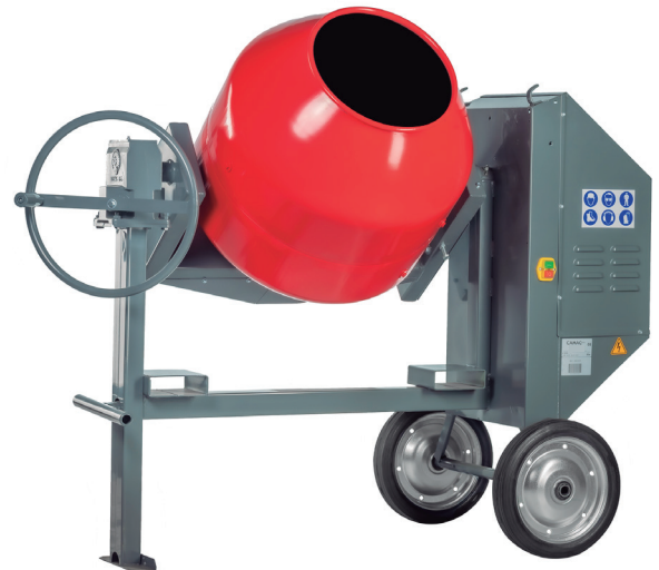
Modelo publicitado: HC.M220